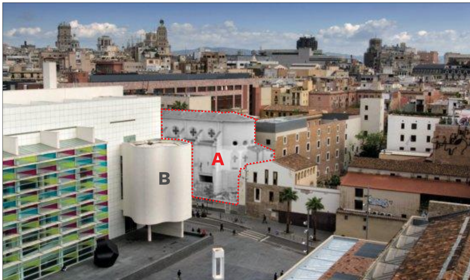
Arriba, fotografía de la plaza de los Àngels con el Macba (B) y enfrente la capilla interior de la Misericòrdia (A). Abajo, maqueta del nuevo edificio de la Fundación IBEI.